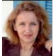
Par Hélé BÉII

Les professeurs du collège pilote de la Manouba en grève ouverte